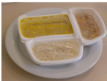
Angebot Pro Senectute Aargau

Einmal pro Monat wird in verschiedenen Gemeinden ein Mittagstisch organisiert. Das Programm und Informationen erhalten Sie bei Pro Senectute Aargau, Beratungsstelle Bezirk Baden, Telefon 056 203 40 80