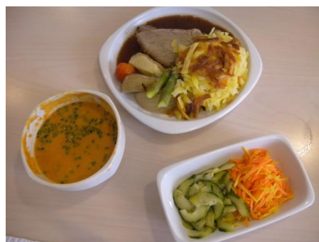
Angebot AZ im Grüt

In der Cafeteria des Alterszentrums. Es stehen verschiedene Menüs zu unterschiedlichen Preisen zur Auswahl. Vorgängige Anmeldung nicht nötig.