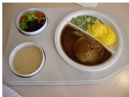
Angebot AZ am Buechberg

In der Cafeteria des AZ am Buechberg. 3x/wöchentlich. Es stehen verschiedene Menüs zur Auswahl. Vorgängige Anmeldung ist notwendig.